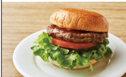
ガンネン gannen バーガー ¥880(税込)

牛肉100%のパンにリーフレタスとトマト、ピクルスの爽やかな酸味とデミグラスソースの相性が抜群です。