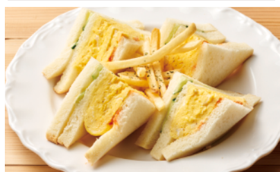
ふわふわ玉子サンド ¥820(税込)