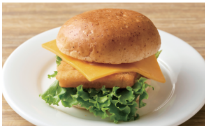
フィッシュフライバーガー ¥730(税込)

カリッと揚げた白身フライとチェダーチーズにフレッシュレタスとピクルス、タルタルソースをかけました。