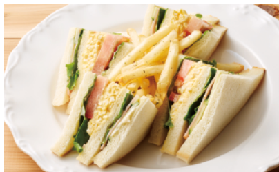
ミックスサンド ¥820(税込)