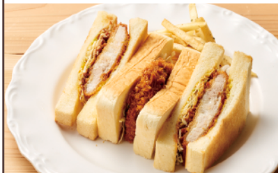
三元豚カツサンド ¥950(税込)

カリッと揚げた白身フライとチェダーチーズにフレッシュレタスとピクルス、タルタルソースをかけました。