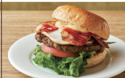
ベーコンエッグバーガー ¥1,020(税込)

珈琲元年こだわりのハンバーガーにチーズをプラスしてまるやかで濃厚な味わいに仕上げました。