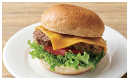
チーズバーガー ¥990(税込)

牛肉100%のパンにリーフレタスとトマト、ピクルスの爽やかな酸味とデミグラスソースの相性が抜群です。